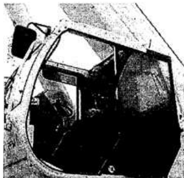
Le grutier, lors de la mise en place de la vigie.