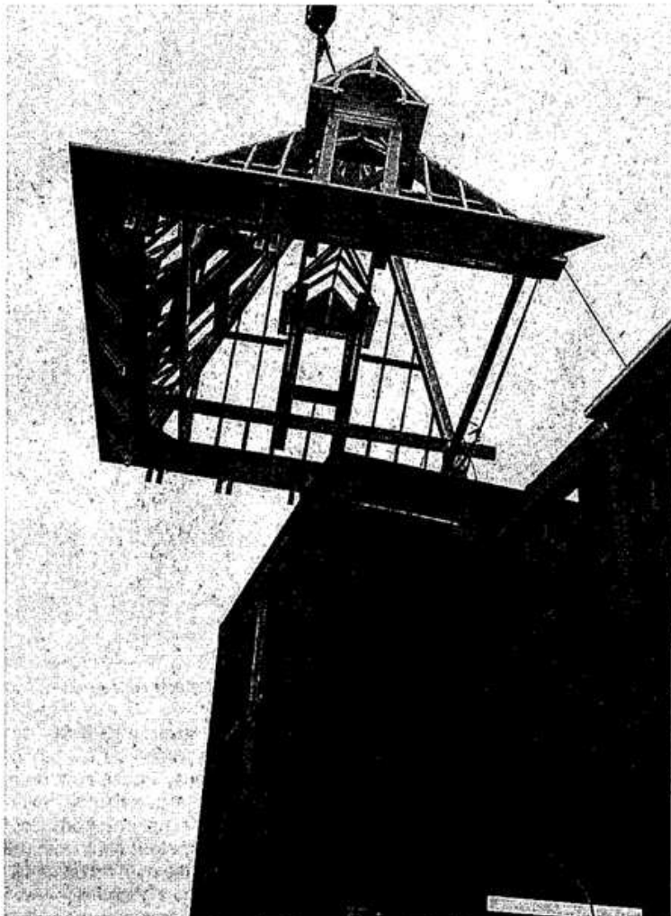
Mise en place de la toiture (le maître d'œuvre supervise l'opération depuis la fenêtre à droite).