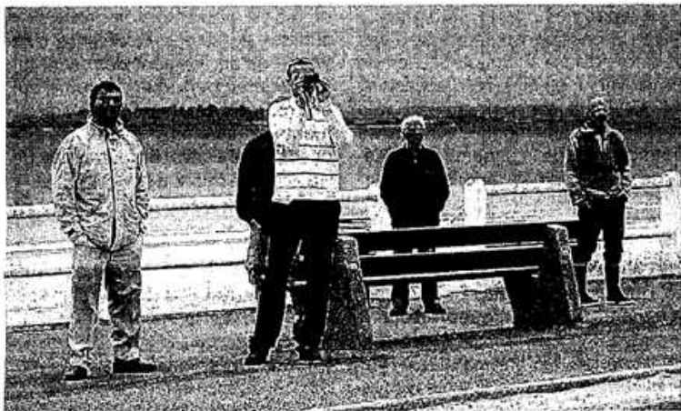
Les badauds sur le boulevard de la Mer.